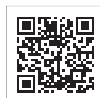
進学資金シミュレーター

※ただし、提示された結果が必ず採用されるとは限りません。あくまで目安として参考にしてください。